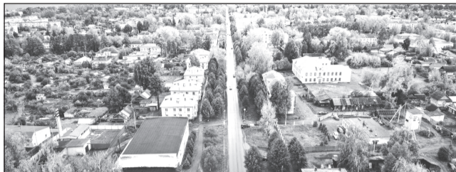
В 2022 г. в области приступят к организации сетей мобильной связи в населенных пунктах с численностью от 100 до 500 человек

неравенства в 2022 году в ведомстве приступят к организации сетей мобильной связи в малых населенных пунктах Ивановской области с численностью от 100 до 500 человек. Соответствующее соглашение уже подписано с Минцифры России и «Ростелекомом». В рамках проекта на территории Ивановской об-