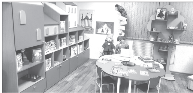
Обновление материально-технической базы - стимул для развития

В 2021 году поддержку в рамках регионального проекта «Творческие люди» нацпроекта «Культура» получили шесть сельских учреждений культуры – победителей регионального конкурсного отбора.