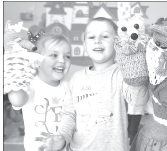
Родители смогут присутствовать на детских утренниках в детских садах.

Изменен порядок проведения мероприятий в государственных театрах, филармонии и цирке. Ранее рассаживать зрителей в зале разрешалось с пятого ряда от края сцены. Теперь эта норма отменяется. Вместе с тем рассадка должна предусматривать соблюдение социальной дистанции между людьми. Нахождение зрителей в проходах во время мероприятия запрещено.