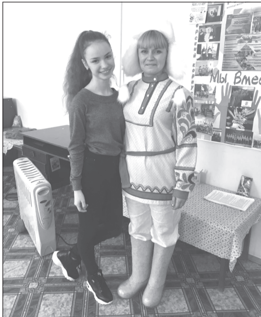
Учиться правильному дыханию сложно, но можно

Путешествия по городам области, выступления на различных конкурсах, поддержка руководителя не дают нам даже на секунду задуматься, что можно уйти.