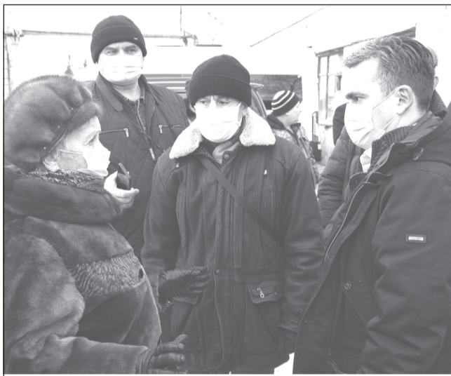
Станислав Воскресенский поручил полностью обследовать систему теплоснабжения микрорайона Красные Сосенки в Тейкове.

В рамках рабочей поездки в Тейково губернатор Станислав Воскресенский встретился с жителями микрорайона Красные Сосенки, которые обратились к нему во время прямой линии 16 ноября, обсудил с ними вопросы теплоснабжения и дал ряд поручений по устранению проблемы.