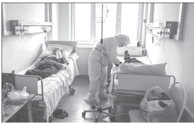
COVID-19 при тяжелом течении воздействует на многие органы и системы организма

Попадая в дыхательные пути, вирус спускается в альвеолы легочной ткани. В организме образуются защитные антитела, возника-